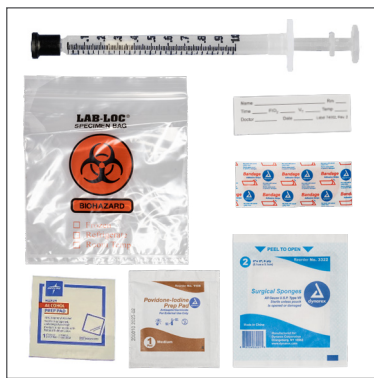
パンクチャーキット